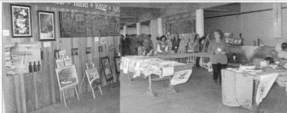
4 (4888-E e 4888-35)