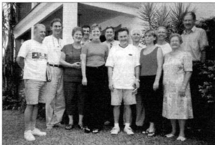
Reunião da Comissão Organizadora, em Taquara-RS, no dia 23/março/2002

Está se acelerando o ritmo dos preparativos que envolvem a organização da grande festa que vai acontecer no próximo dia 15 de setembro, em Taquara-RS