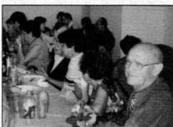
Vista parcial do evento