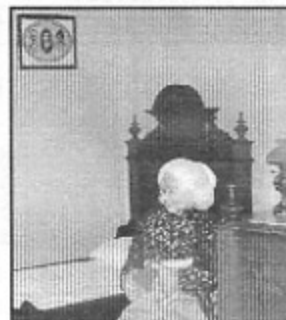
Vista parcial do quarto de dormir

ESCREVA UM ARTIGO PARA PUBLICAR NO NOSSO BOLETIM INFORMATIVO. ANIME-SE.