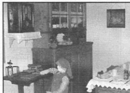
Vista parcial da sala de jantar com a mesa posta